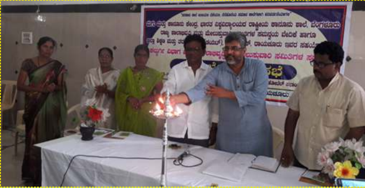
ಶಾಲಾಭಿವೃದ್ಧಿ ಮತ್ತು ಮೇಲುಸ್ತುವಾರಿ ಸಮಿತಿಗಳ ಸಮನ್ವಯ ವೇದಿಕೆಯ ಗುಲ್ಬರ್ಗ ವಿಭಾಗೀಯ ಮಟ್ಟದ ಸಭೆ, ರಾಯಚೂರು