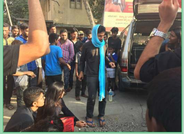
ಬೆಂಗಳೂರಿನ ಟ್ಯಾನಿ ರೋಡ್ ನಲ್ಲಿ ನಡೆದ ಅಹಾರದ ಹಕ್ಕು ಕುರಿತಂತೆ ನ್ಯಾಷನಲ್ ಲಾ ಸ್ಕೂಲ್ ವಿದ್ಯಾರ್ಥಿಗಳಿಂದ ಬೀದಿ ನಾಟಕ. ದಿನಾಂಕ: 9.11.2016