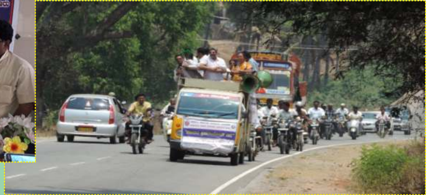
ದಾಖಲಾತಿ ಆಂದೋಲನದ ಭಾಗವಾಗಿ ಮಾಗಡಿ ತಾಲ್ಲೂಕಿನ ಮೋಟಗೊಂಡನ ಹಳ್ಳಿ ಪಂಚಾಯತಿಯಿಂದ ಮಾಗಡಿಯವರೆಗೆ ಬೈಕ್ ರ್ಯಾಲಿ, ರಾಮನಗರ ಜಿಲ್ಲೆ