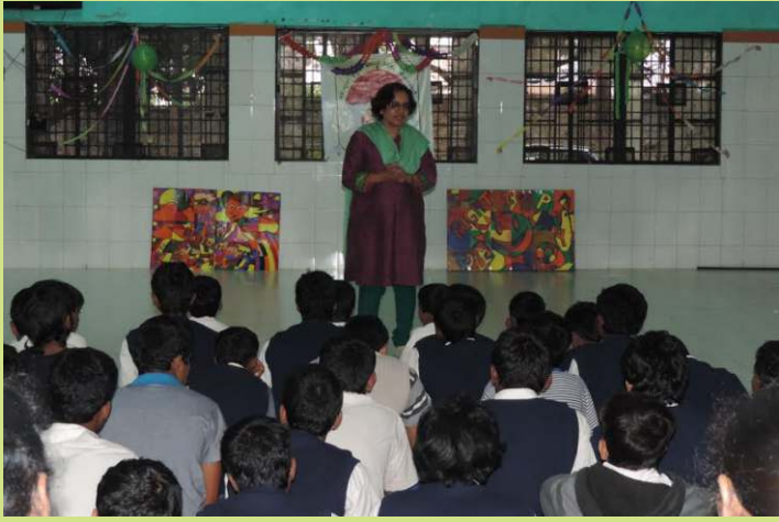
ಮಡಿವಾಳದ ಪರಿವೀಕ್ಷಕಾಲಯದಲ್ಲಿ ನಡೆದ ಮಕ್ಕಳ ದಿನಾಚರಣೆ ಕಾರ್ಯಕ್ರಮ ದಿನಾಂಕ: 14.11.2016