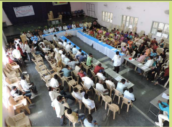
ಶಿಕ್ಷಣ ಹಕ್ಕು ಕುರಿತಂತೆ ಸಂಪನ್ಮೂಲ ಸಾಹಿತ್ಯ ಸಮಾವೇಶ