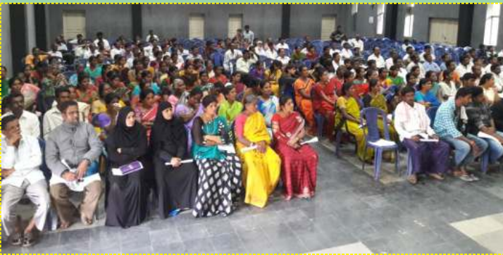
ರಾಮನಗರ ಜಿಲ್ಲಾ ಮಟ್ಟದ ಶಾಲಾಭಿವೃದ್ಧಿ ಮತ್ತು ಮೇಲುಸ್ತುವಾರಿ ಸಮಿತಿಗಳ ಸಮನ್ವಯ ವೇದಿಕೆ ಸಮಾವೇಶದಲ್ಲಿ ನೆರೆದಿದ್ದ ಎಸ್ ಡಿ ಎಮ್ ಸಿ ಜನಸ್ಮೋಮ