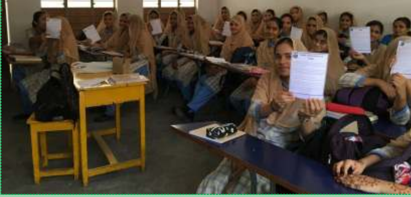
ಶಿಕ್ಷಣ ಹಕ್ಕು ಕಾಯ್ದೆ ಕುರಿತಂತೆ ಕಾನೂನು ಅರಿವು ಕಾರ್ಯಕ್ರಮ. ಸ್ಥಳ: ಅಬ್ದುಲ್‌ಘಾಠಿ ಊರ್ದುಶಾಲೆ ಬೆಂಗಳೂರು ದಿನಾಂಕ: 10.08.2016