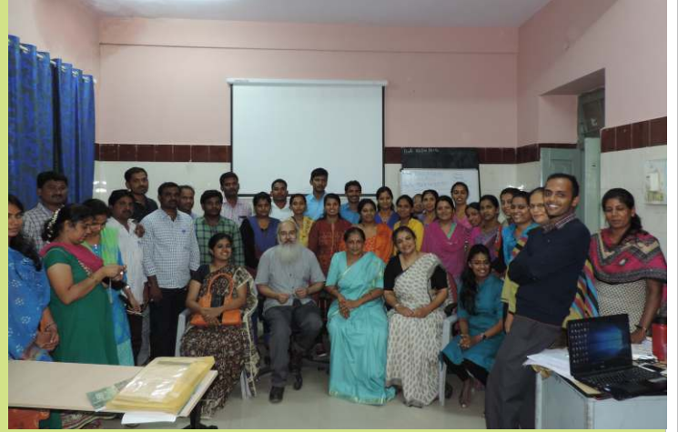
ಬಾಲಕರ ಬಾಲಮಂದಿರದಲ್ಲಿ ನಡೆದ ಕೌನ್ಸಿಲರ್‌ಗಳ ತರಬೇತಿ ಕಾರ್ಯಾಗಾರ ದಿನಾಂಕ: 22.06.2016