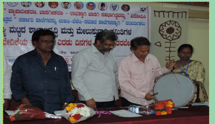
ತಮಟೆ ಬಾರಿಸುವ ಮೂಲಕ ರಾಜ್ಯ ಮಟ್ಟದ ಶಾಲಾಭಿವೃದ್ಧಿ ಮತ್ತು ಮೇಲುಸ್ತುವಾರಿ ಸಮಿತಿಗಳ ಸಮನ್ವಯ ವೇದಿಕೆ ಕಾರ್ಯಕಾರಿ ಸಭೆ ಉದ್ಘಾಟನೆ, ಬೆಂಗಳೂರು