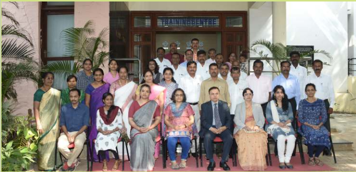
ಮಗು ಮತ್ತು ಕಾನೂನು ಕೇಂದ್ರ ಮತ್ತು ಕಾನೂನು ಸೇವಾ ಪ್ರಾಧಿಕಾರದ ಸಹಯೋಗದಲ್ಲಿ ಬೆಂಗಳೂರಿನಲ್ಲಿ ನಡೆದ ವಕೀಲರ ಸಾಮಾಜ್ಯಭಿವೃದ್ಧಿ ಕಾರ್ಯಾಗಾರ ದಿನಾಂಕ: 06.11.2016