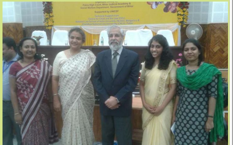
ಬಾಲನ್ಯಾಯ (ಪಾಲನೆ ಮತ್ತು ಸಂರಕ್ಷಣೆ) ಕಾಯ್ದೆ 2000ದ ಕುರಿತಂತೆ ಪ್ರಾದೇಶಿಕ ಹಂತದ 2ನೇ ದುಂಡುಮೇಜಿನ ಸಭೆ ದಿನಾಂಕ: 29.08.2015 ಪಾಟ್ನಾ